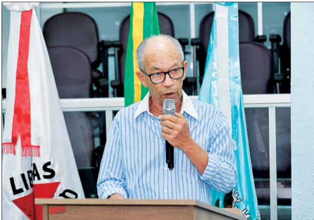
Jaime disse não ser contra a festa, mas pediu bom senso político.

O participante fez um paralelo com o show da cantora Madona, realizado recentemente na Praia de Copacabana, no Rio de Janeiro, bancado pela iniciativa privada, com participação do poder público, sendo R$ 40 milhões de um patrocinador; R$ 10 milhões da Prefeitura e R$ 10 milhões do estado. O show foi de graça e redun-