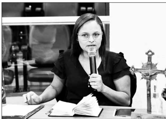
Jaqueline: combater a poeira, para proteger a saúde dos residentes.

De acordo com o texto do requerimento, trata-se de uma medida importante para abrandar os problemas causados pela poeira, especialmente durante períodos secos e cujo acúmulo pode causar sérios problemas respiratórios, como asma, alergias e bronquites, especialmente em crianças e idosos, que são mais vulneráveis a essas condições. Entende a vereadora que a aplicação de cascalho ou escória pode ajudar