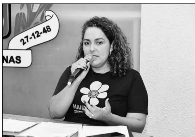
Projeto de Whatiffa estabelece normas gerais do “Maio Laranja” no município.

São objetivos específicos do “Maio Laranja”: promover atividades para conscientização da população para enfrentamento ao abuso e à exploração sexual de crianças e adolescentes; promover formas