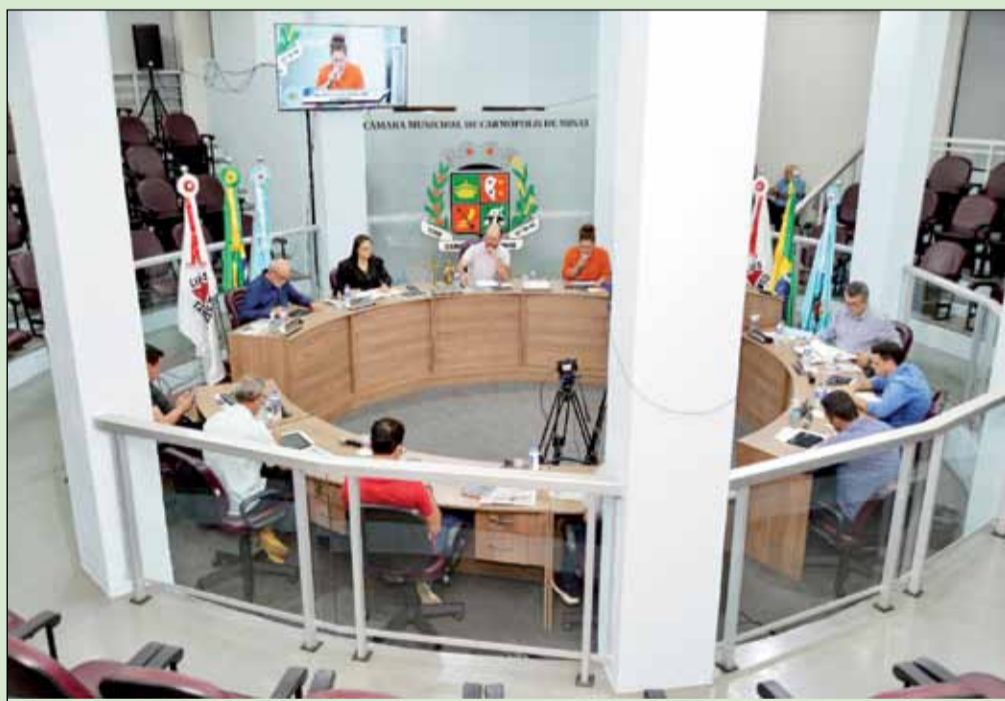
Os vereadores aprovaram a iniciativa do Executivo por unanimidade.