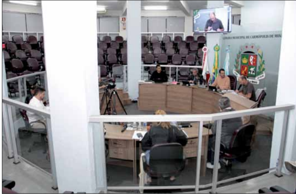
Maioria dos vereadores aprovou a matéria com uma emenda supressiva.

Requerimentos Solicitações dos vereadores ao Poder Executivo, aprovadas em plenário e encaminhadas aos setores competentes.