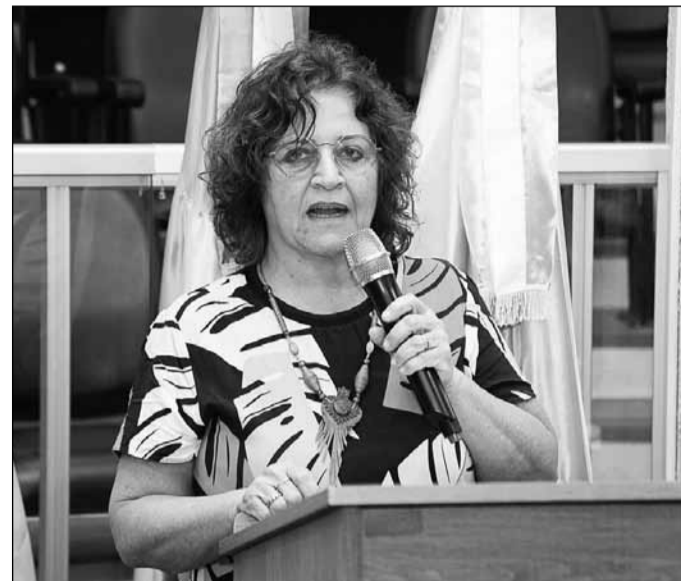
Honoralice pediu uma cidade onde se possa viver de verdade.

Destacou a existência de um grupo de rede social com mais de quatrocentos participantes e um abaixo-assinado com mais de 150 assinaturas,