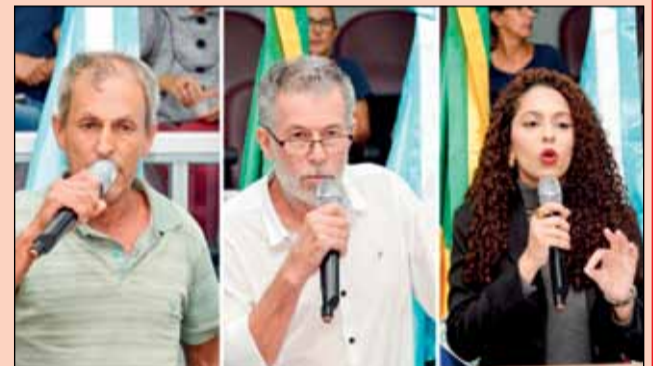
Representantes do grupo questionaram o Poder Executivo e defenderam a manutenção total dos espécimes.