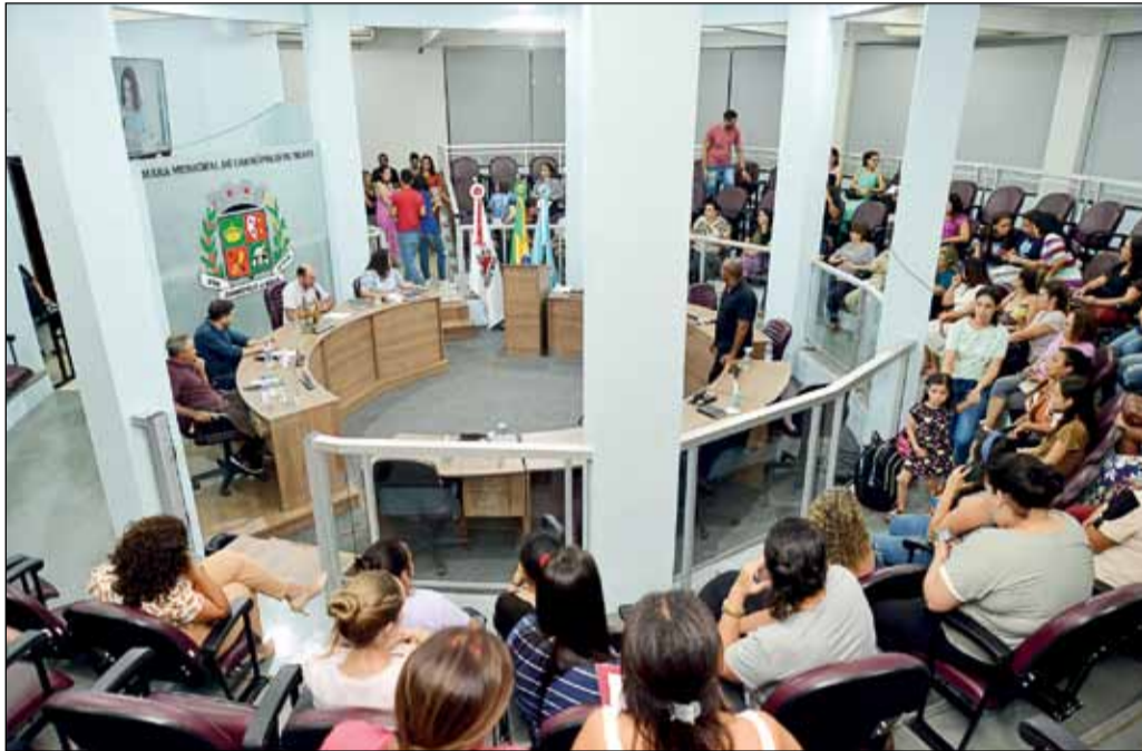
Representantes sociais participam, na Câmara, da abertura do "Abril Azul".

Por iniciativa do Poder Legislativo, com apoio do Poder Executivo, Sicoob, Polícia Militar, Universidade Cruzeiro do Sul, Grupo de Mães Atípicas Florescer Depois do Autismo, Centro de Ecoterapia de Carmópolis de Minas (ANTERAP), Associação de Pais e Amigos dos Excepcionais (APAE) e Associação de Surdos de Carmópolis, foi realizado, no âmbito do município, em abril de 2024, o Mês de Conscientização sobre o Autismo (Campanha Abril Azul). A abertura ocorreu no dia 03, no plenário da Câmara, com palestra e grande participação da comunidade. No transcorrer do mês foram realizadas várias atividades coletivas.