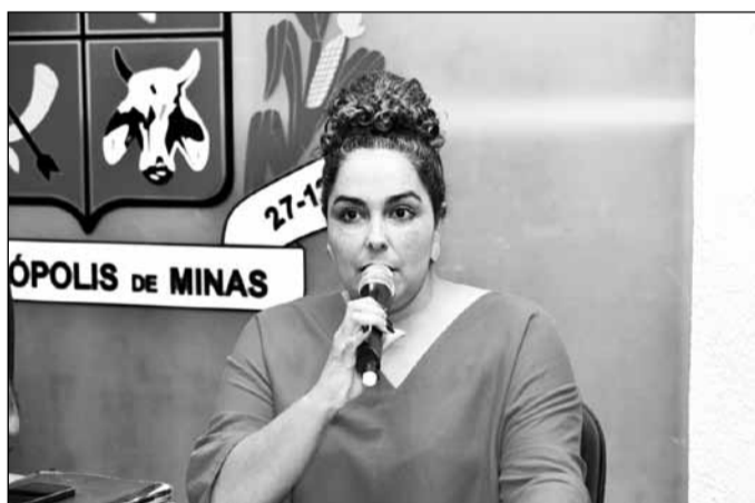
Whatiffa apresentou dois requerimentos solicitando as contratações.

Apresentado na sessão ordinária do dia 8 de abril de 2024, o requerimento que pede o intérprete de LIBRAS aponta para a criação e manutenção de um canal de atendimento de tradutores, para atendimento das repartições públicas, destinado a deficientes auditivos ou de fala. O canal poderia ficar à disposição dos órgãos públicos para atendimento nos horários comerciais, oferecendo