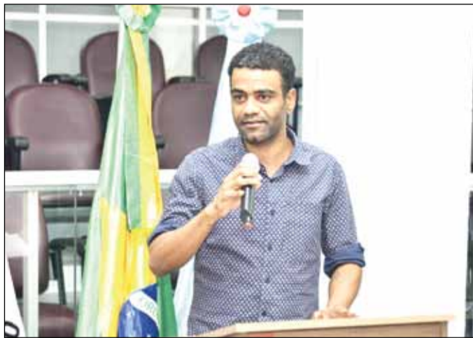
Kennedy pediu a criação de alternativas para as crianças.

“Querida saber se é possível a vocês fazerem algo para melhorar a vida das crianças”, argumentou ele. E citou o exemplo de meninas e meninos dos bairros, que convivem com mais essa carência, além de outras, inclusive de ordem alimentar. Como morador do