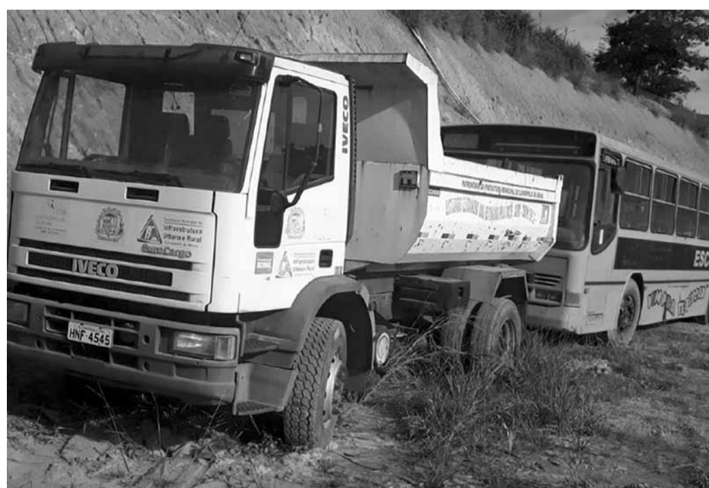
Veículos estão em aparente bom estado.

Durante a sessão ordinária na qual o requerimento foi aprovado, o autor da matéria informou ao plenário que esteve no parque de exposições onde os veículos se encontram, entre eles ônibus e um caminhão-caçamba, em aparente bom estado de conservação e que ainda podem prestar serviços à comunidade, de forma mais direta às secretarias da Educação e de Obras.